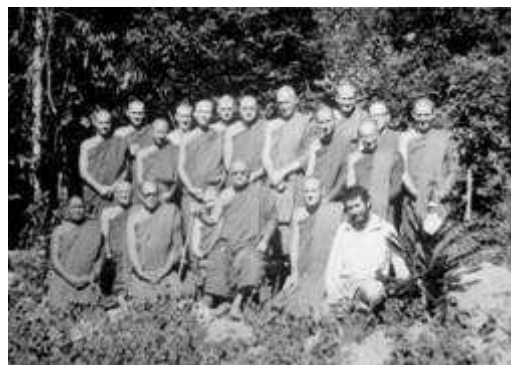
หลวงพ่ochaกับพระเถรวัดป่านานาชาติ

ในปี พ.ศ. ๒๕๑๐ พระสุเมโธได้มาอยู่กับหลวงปู่ชาเป็นครั้งแรก หลังจากนั้นก็ได้มีพระฝรั่งทยอยกันเดินทางเข้ามาอยู่กับหลวงพ่ochaมากขึ้น