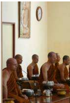
คณะสงฆ์วัดป่านานาชาติก่อนนั้น

ในปัจจุบัน พระเถรสังกัตวัดป่านานาชาติที่มีอยู่ในเมืองไทย ทั้งหมด ประมาณ ๔๐ รูป รวม ๑๘ สัญชาติ เป็นชาว