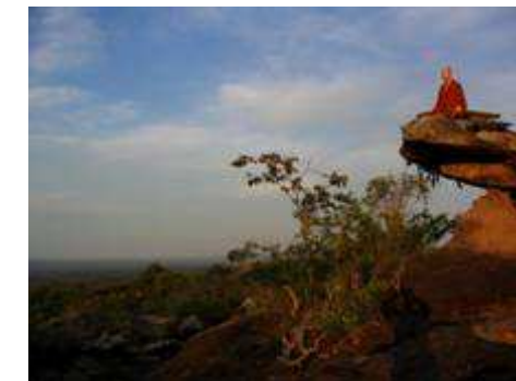
วัดภูจ้อมก้อม

ปัจจุบันได้กลายเป็นป่าที่สมบูรณ์ขึ้นมา พ.ศ.๒๕๔๑ ได้รับพระราชทานวิสุงคามสีมาเป็นวัด วัดป่านานาชาติมีสาขา ๒ แห่ง คือ วัดภูจ้อมก้อม อ.โขงเจียม จ. อุบลราชธานี