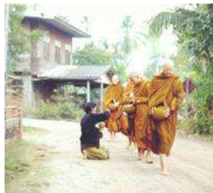
เดินบิณฑบาตที่บ้านนุ่งหวาย

“เราอยู่คนละประเทศได้มาอยู่รวมกันที่นี้ มันเป็นเรื่องแปลกเหมือนกัน ประชาชนทั้งหลายเห็นพวกท่านทั้งหลาย ซึ่งอยู่ในเมืองนอก มารวมกันอยู่ในเมืองไทย มาฉันข้าวเหนียวก็ได้ มาพูดภาษาไทยก็ได้ มาพูดภาษาลาวก็ได้ มาอยู่ที่กรุงเทพฯ ยากๆลำบากก็อยู่ได้ อย่างนั้นผมจึงพูดไป เมื่อไปกรุงลอนดอน ว่า ท่านพวกนี้จะต้องไปทำดอกเตอร์ ที่วัดหนองป่าพง คือเปลี่ยน ผมมีความรู้สึก ว่า พวกท่านตายไปแล้วฟื้นขึ้นมา คือมาพบ ปรับตัวเข้ากับ