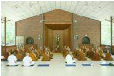
พระเถรนั่งสมาธิที่ศาลาออก

กับวัดหนองป่าพงอย่างใกล้ชิด ถึงแม้ว่าหลวงพ่อกษาท่านได้มรณภาพไปหลายปีแล้ว เพราะเจ้าอาวาสวัด