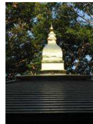
ยอดพระอุโบสถ

ในปี พ.ศ. ๒๕๒๘ เริ่มสร้างพระอุโบสถในตำแหน่งที่พบเสมาเก่า เพื่อให้พระสงฆ์ใช้สวดทำสังฆกรรมต่างๆ และเป็นที่อบรมพระสงฆ์สามเณร พระอุโบสถสร้างเสร็จในอีก ๒ ปีต่อมา เนื่องจากพระชาวต่างประเทศ มีเพิ่มมากขึ้นทุกปี ญาติโยมจึงได้มีจิตศรัทธาถวายที่ดินเพิ่ม ปัจจุบัน (พ.ศ. ๒๕๕๑) มีเนื้อที่วัดทั้งหมด ๓๕๖ ไร่ ๓ กว้าง ๓๗ หลัง พ.ศ. ๒๕๓๖ ได้ทำกำแพงล้อมรอบวัด และได้มีการปลูกป่าทดแทนขึ้นจากเดิมที่เป็นไร่ปลูกที่ถุกทิ้งร้างไว้