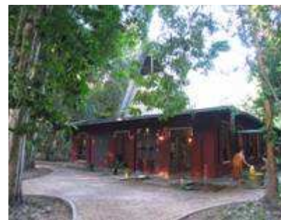
ธรรมศาลา

๒๕๑๙ คณะศรัทธาญาติโยมได้นำกลิ่นมาทอดและได้สร้างศาลาใหม่โดยหลวงพ่ochaเป็นผู้ออกแบบ และกำหนดขนาดเอง