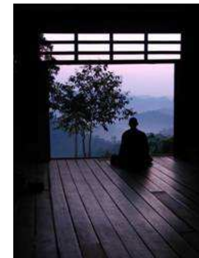
สำนักสงฆ์เต่าดำ

และ สำนักสงฆ์เต่าดำ อ. ไทรโยค จ. กาญจนบุรี